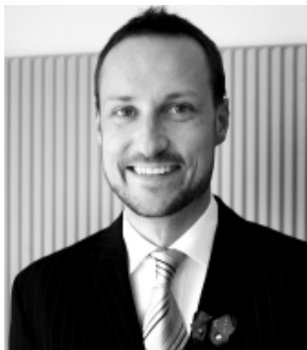
Kronprins Haakon er høy beskytter for årets TV-aksjon.

Kronprins Haakon er høy beskytter for årets TV-aksjon.