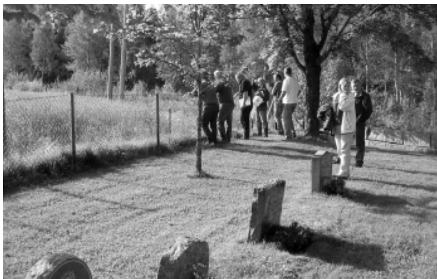
Representanter for de ulike firmaene, Grindaker as som er kommunens konsulent og våre egne folk på anbudsbehandling.

- Etter en forhåndsutvelgelse av aktuelle entreprenører, er følgende firma invitert til å gi anbud på 1. etappe av kirkegårdsutvidelsen ved Varteig kirkegård. Disse firmaene er Sarpsborg Park & Anlegg as, Askim Entreprenør AS, ISS Skaaret AS og Calluna Grøntanlegg AS. De to sistnevnte firmaene har hatt lignende oppdrag i Sarpsborg tidligere, mens de to andre har gode referanser til