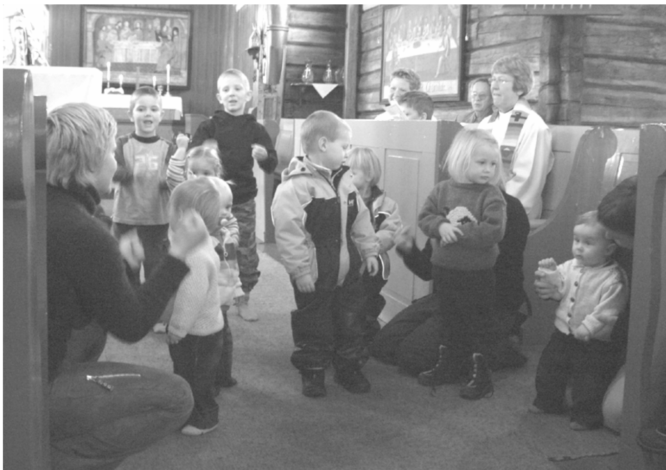
Gudstjeneste i Hedalen Stavkirke.