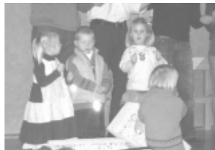
På siste Storsamling var det noen av de minste som hjalp Lovsangsteamet med å synge.

«VI-normisjon» ønsker med sitt arbeid å være en inkluderende og livskraftig forening der medlemmene, på tvers av generasjoner, kan arbeide for selv å vokse i troen og få bringe budskapet om Jesus ut i nærmiljøet og ut i verden.