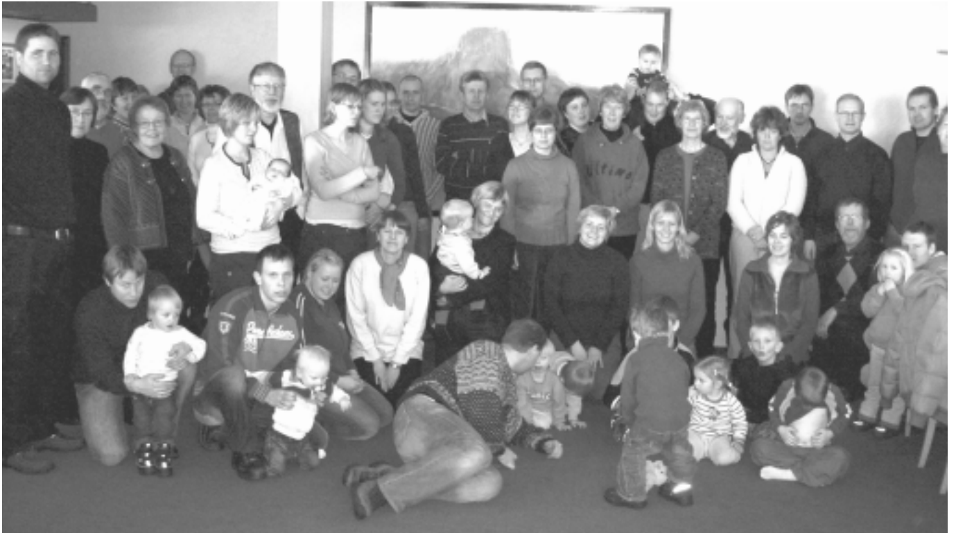
Disse var på tur!

Mange av oss kom nok også hjem med en litt annen kropp enn den vi hadde når vi reiste. I hvert fall kjentes det sånn. Mange timer med skigåing, lange – og store måltider, aking og andre uteaktiviteter gjør utslag.