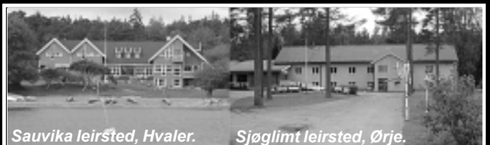
Sauvika leirsted, Hvaler.

Priser og nærmere opplysninger kan fås ved KFUM/KFUKs krets-kontor, tlf.69 31 78 94.