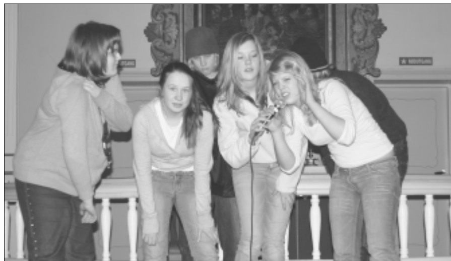
Fra framføringen av konfirmantenes musical i Varteig kirke søndag 19. mars 2006.