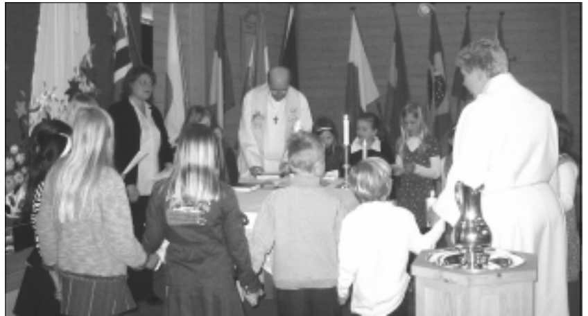
Gudstjenesten ble innledet med at kor, prest og kateket dannet en ring rundt alteret.