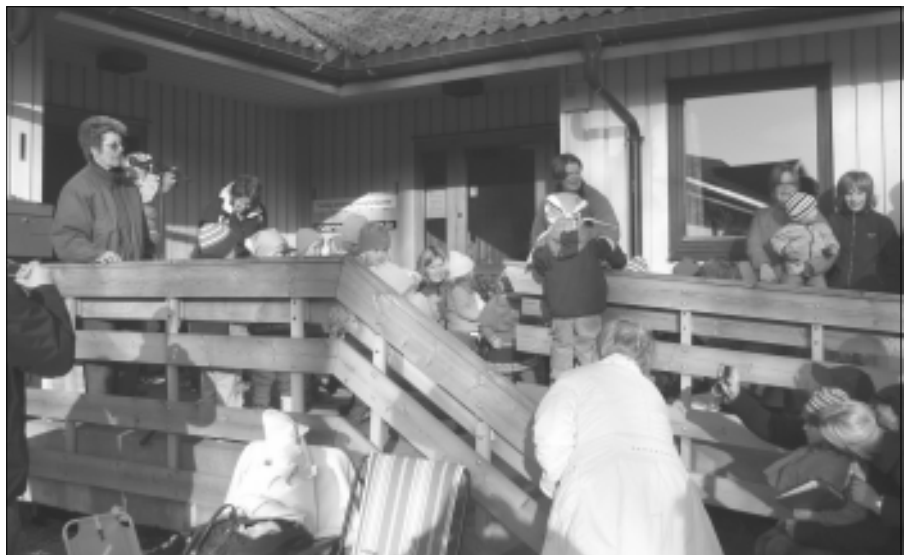
Alt klart for utedag for barnesangen i Varteig menighet...

Lederne i Barnesangen, (Babysang/ Småbarnsang/Minsten) takker for en fin kveld sammen med dere alle.