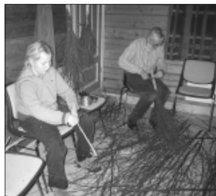
Fra fjorårets adventsverksted, her blir det laget sopelimer.

ting før og underveis i gudstjenestene. Slik vil de få et bedre kjennskap til gudstjenestelivet i kirken, og menigheten vil bli bedre kjent med konfirmantene. Vi ber om at dere som er menighet tar godt i mot dem, og ønsker konfirmantene lykke til også i dette.