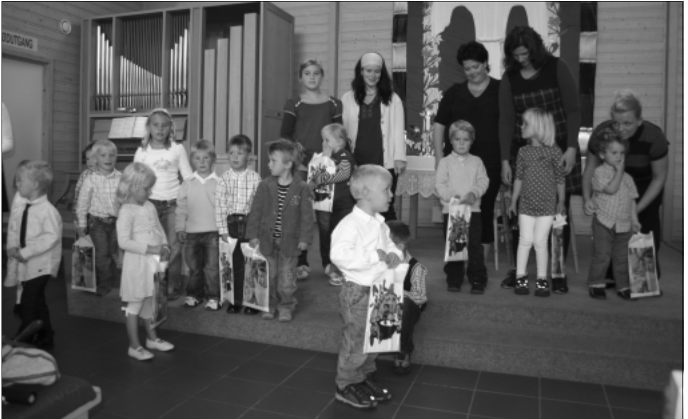
Det var en flott gjeng 4-åringene som kom til Hafslundsøy kirke for å få fireårs-bøker på familiegudstjenesten.