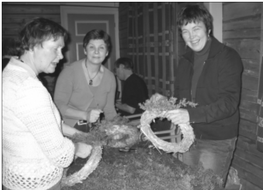
Enerkransene var blant det som var veldig populært på auksjonen i fjor.