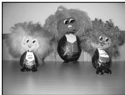
Vandretrollet i midten.

Siste frist for å levere startkortene er kl.13.15, premieutdeling ca. kl.13.30. Etter endt rundtur er det mulig å få kjøpt