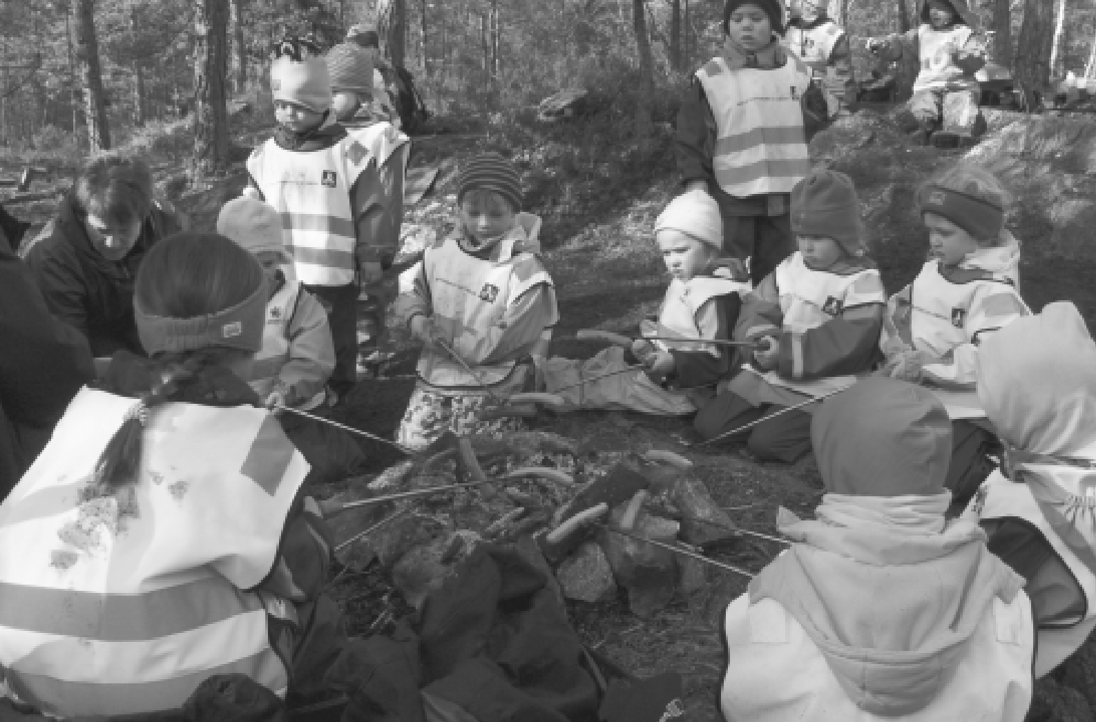
Utedag med pølsegrilling er fast post på programmet.