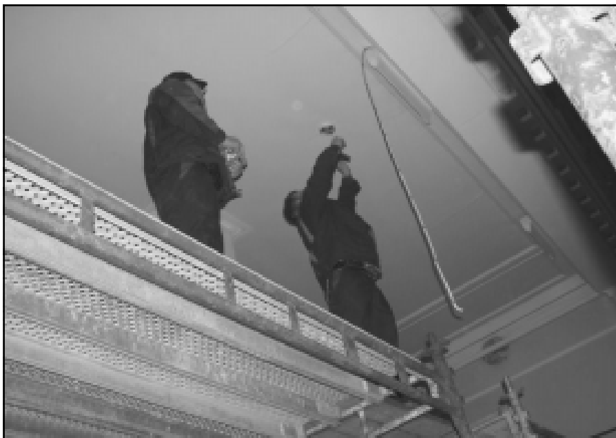
Arbeid med det elektriske anlegget oppunder taket.

Komiteen har samarbeidet med System & Miljøbelysning as om valg av ny belysning. I tillegg til tekniske beregninger av lysstyrke, har komiteen gjort en grundig vurdering av valg av lysarmaturer. Det er valgt lamper av høy kvalitet fra en tysk produsent. I