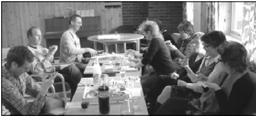
Kveldskos på Hasle menighetssenter.

Det store i høst blir en tur til Roma. Det er 19 som har meldt seg på og forberedelsene er allerede i gang. På bildene ser vi fra et infomøte om turen. Ellers av program kan vi nevne en dugnadstur til Tjellholmen og tur med omvisning på Hafslund hovedgård (se siste side).