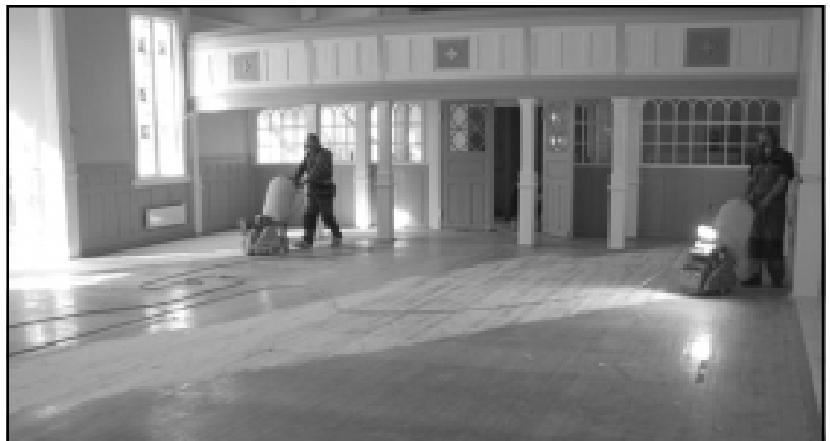
Gulvene i Varteig kirke er slipt ned og lakkert.