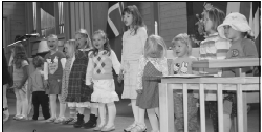
Sangkoret «Minsten» sang under familiegudstjenesten.

«Min kirkebok» ble delt ut til fire-åringene, som var spesielt invitert til gudstjenesten. Da alle bøkene var delt ut, sang alle en del av de fine barne-sangene, som også står i kirkeboken.