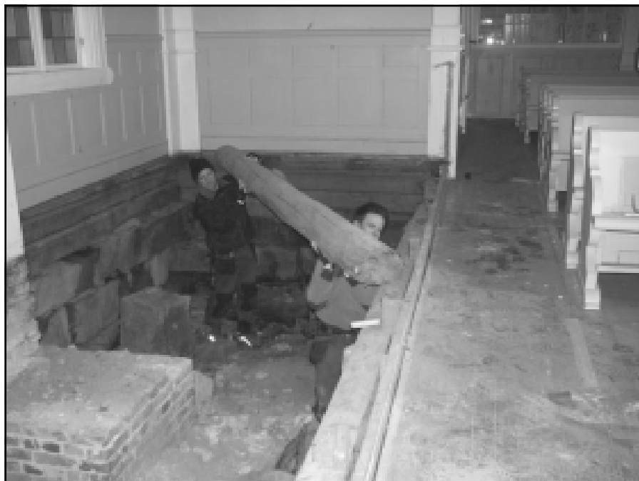
Det er blitt gjort en meget grundig jobb med restaureringen av Varteig kirke.

I forbindelse med oppussingen er fargevalget det samme som tidligere på vegger og tak. En del veggstrie er rettet opp slik at større skrukker nå er borte. I taket er imidlertid strien fjernet og det er lagt tre lag med gipsplater. Begrunnelsen for dette er å oppnå bedre etterklang i rommet, og vi tror at dette sammen med fjerning av heldekkende teppe i koret har gitt bedre akustiske forhold for sang og musikk.