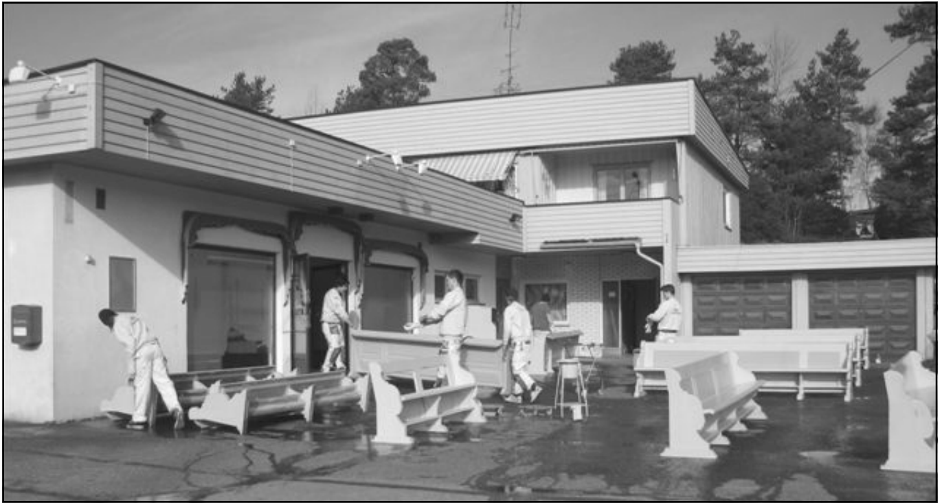
Elever fra Borg videregående skole sørget for at kirkebenkene ble malt, og Hasle Handel stilte velvillig egnede lokaler til disposisjon.

skrivende stund har vi ennå ikke sett det endelige resultatet av dette, men vi håper at ny belysning vil gi interiøret en ytterligere forbedring. Nye lyskilder til tross; den store lysekronen midt i kirken skal fortsatt henge på sin plass.