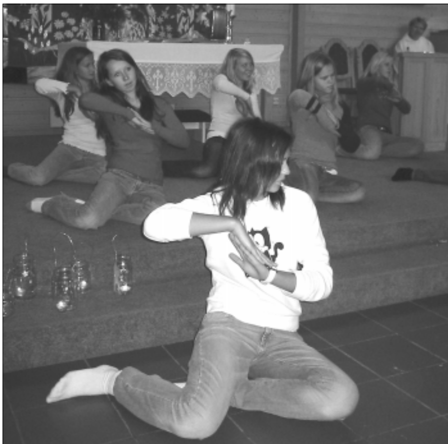
Fra et tidligere konfirmantkulls fremføring i Hafslundsøy kirke. (Arkivbilde)

Nå legges siste hånd på konfirmantprogrammet for 2008/2009-konfirmantene.