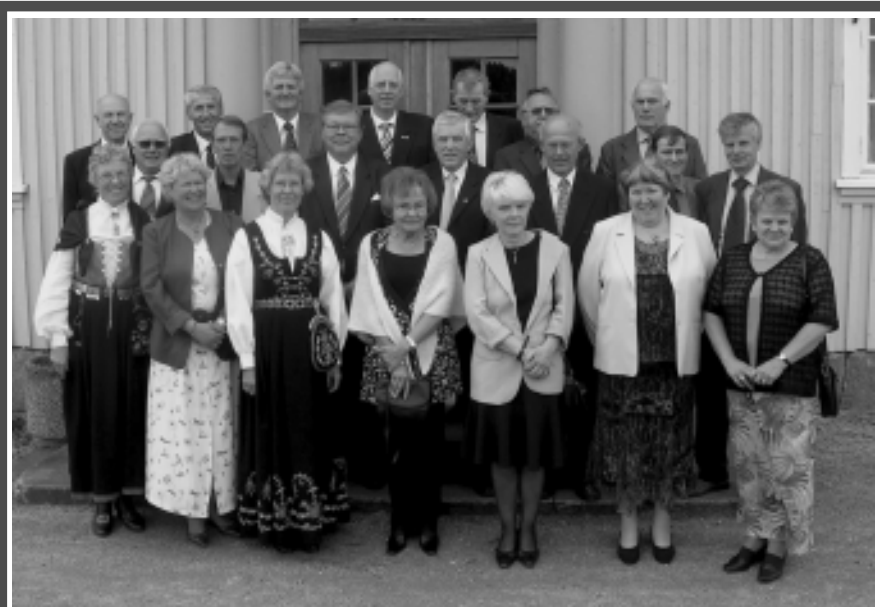
50-års konfirmantene var samlet på bygdedagen i Varteig.