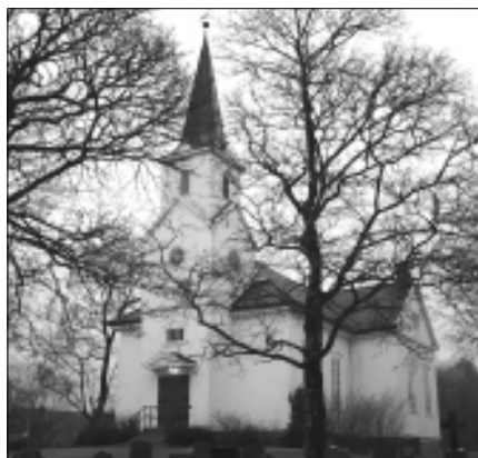
Varteig kirke er 150 år neste år, og det vil bli markert med ulike arrangementer.

Det arbeides også et et eget jubileumsskrift som vil fortelle om kirkens historie og små og store begivenheter i Varteig.