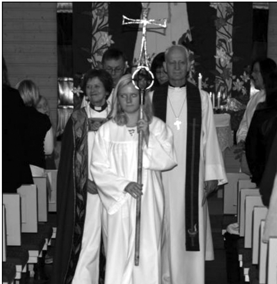
Fra visitasgudstjenesten i Hafslundsøy kirke den første søndagen i desember.

Biskopen har inntrykk av at menigheten har gode relasjoner til kommunen, til skoler og barnehager og til den frivillige organisasjonslivet.