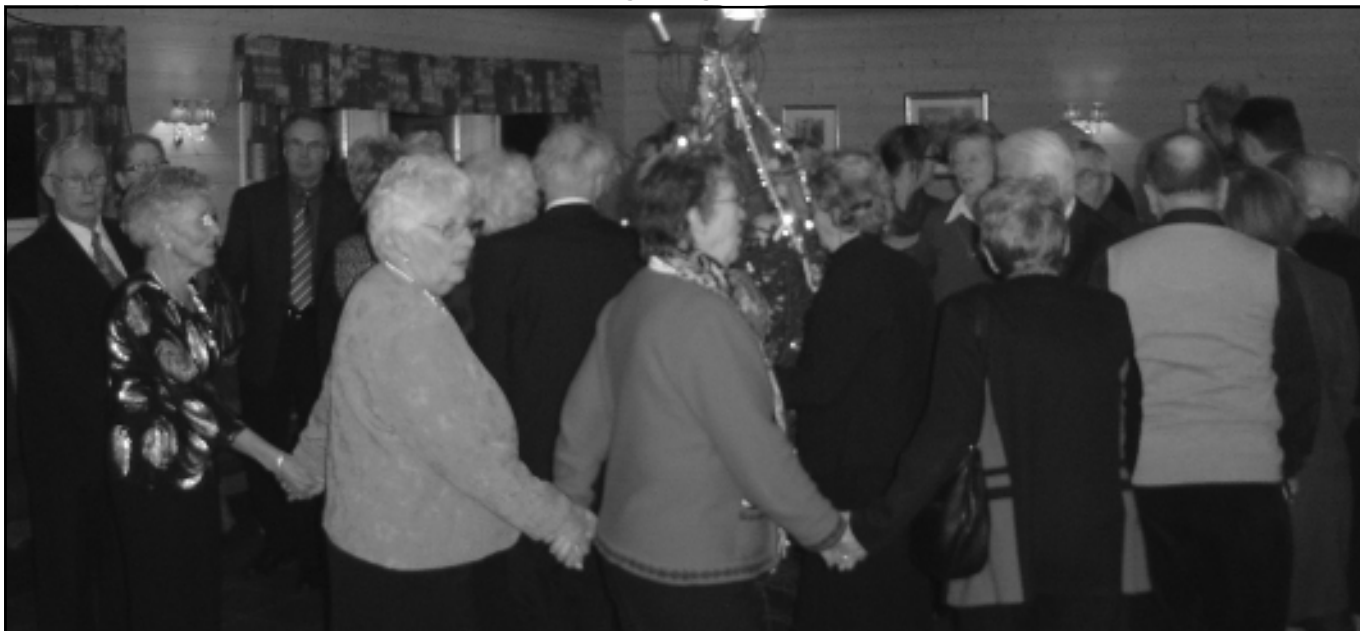
Gang rundt juletreet i Hafslundsøy kirke.