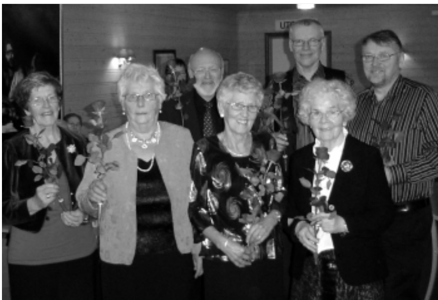
Det var mange som stod på for å lage julefest i Hafslundsøy kirke.