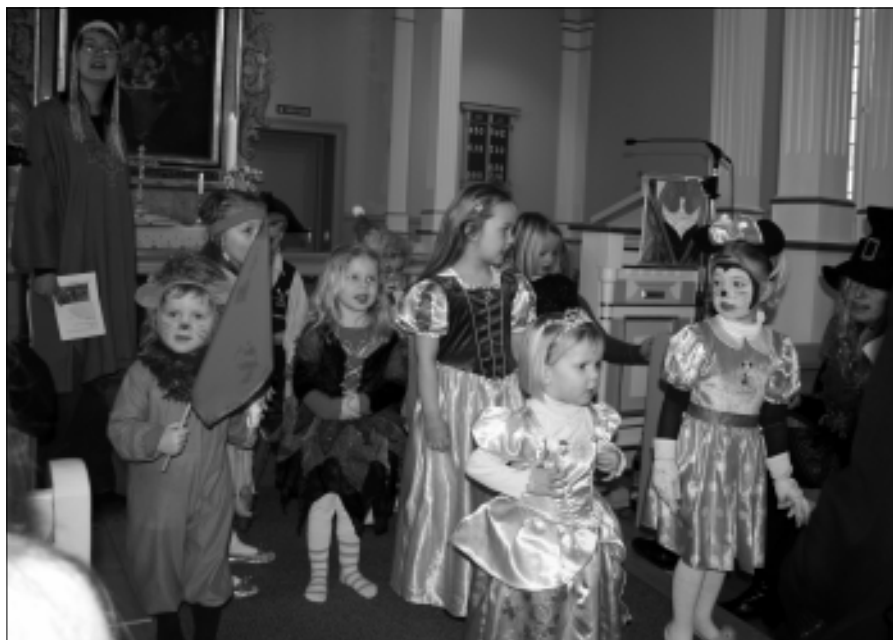
I forbindelse med kirkejubileet i Varteig var det jubileumsarrangementer så godt som hver eneste måned i kirken. I februar var det karnevalsgudstjeneste.