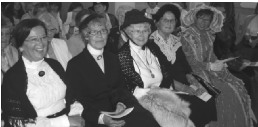
I juni ble det arrangert gudstjeneste anno 1859 i Varteig kirke, og mange hadde funnet fram tidsriktig tøy.

undervisning på onsdagskvelder og på lørdager med ulike temaer. To av lørdagene, har det vært besøk fra voksne i menigheten som forteller fra sitt liv og sin tro. Konfirmantene har vært på pilegrimsvandring i Skjebergdalen, som en del av opplegget. I tillegg har de vært med på ungdomsklubben Con Dios, og de er med som ministranter på gudstjenestene. Konfirmantforeldre er med på onsdagskveldene i kirkene og lørdagssamlingene på Hasle. De bidrar med voksent nærvær og med severing av mat.