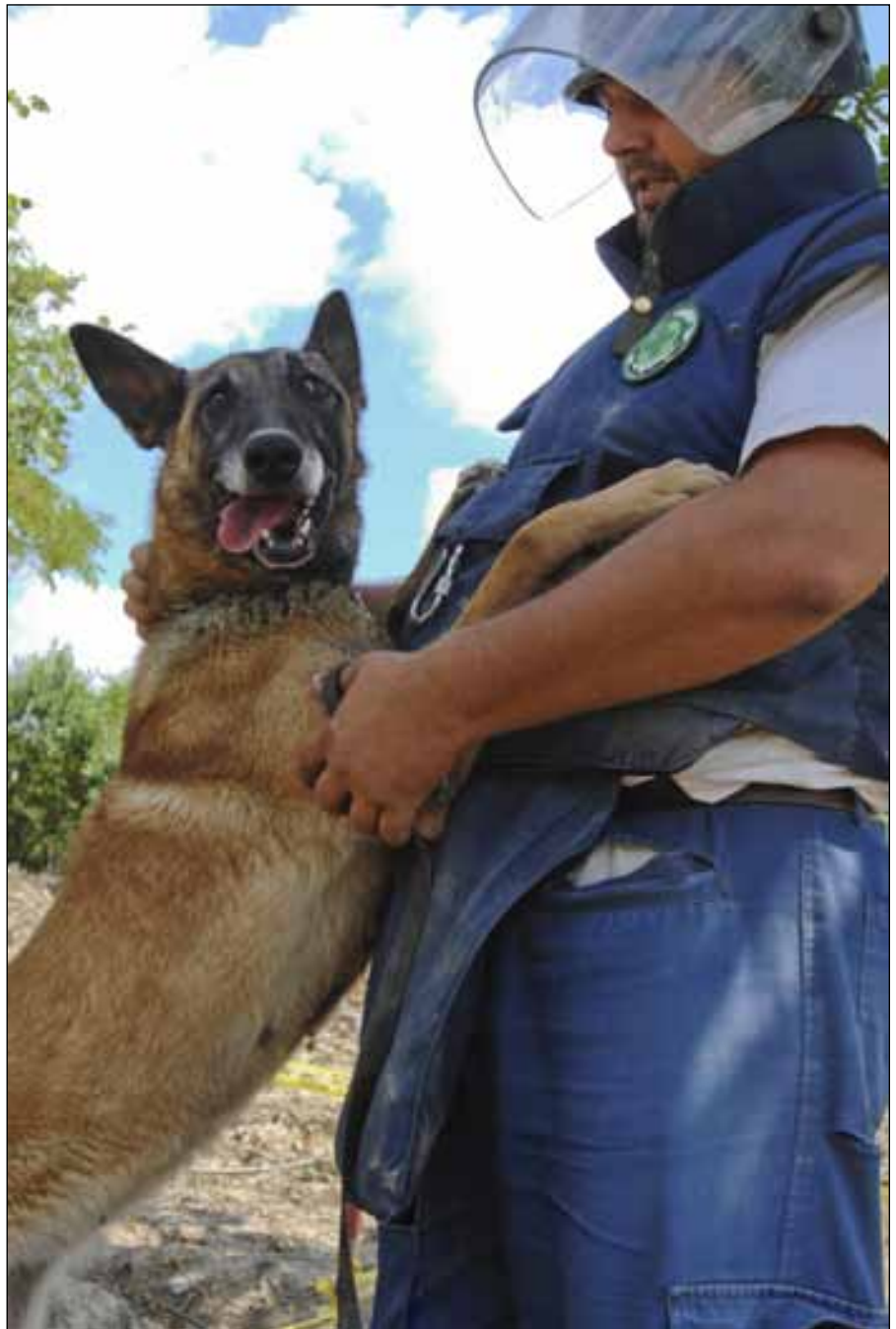
Minehund med trener.

TV-aksjonen har vært gjennomført hver eneste høst siden 1974 og er blitt en institusjon og en tradisjon i Norge.