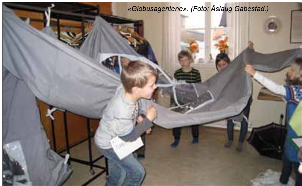
«Globusagentene».