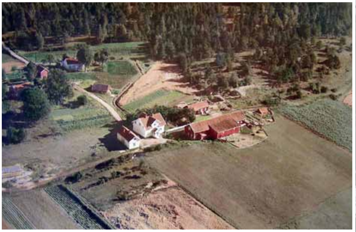
Flyfoto av Vestby (2096/9) fra 1952. Gårdsbebyggelsen med bolig, lagård og bryggerhus ble reist av Ove og Emma Vestby tidlig på 1900-tallet. Det er for øvrig samme bebyggelsen som fortsatt står på gården, om enn restaurert i flere omganger.