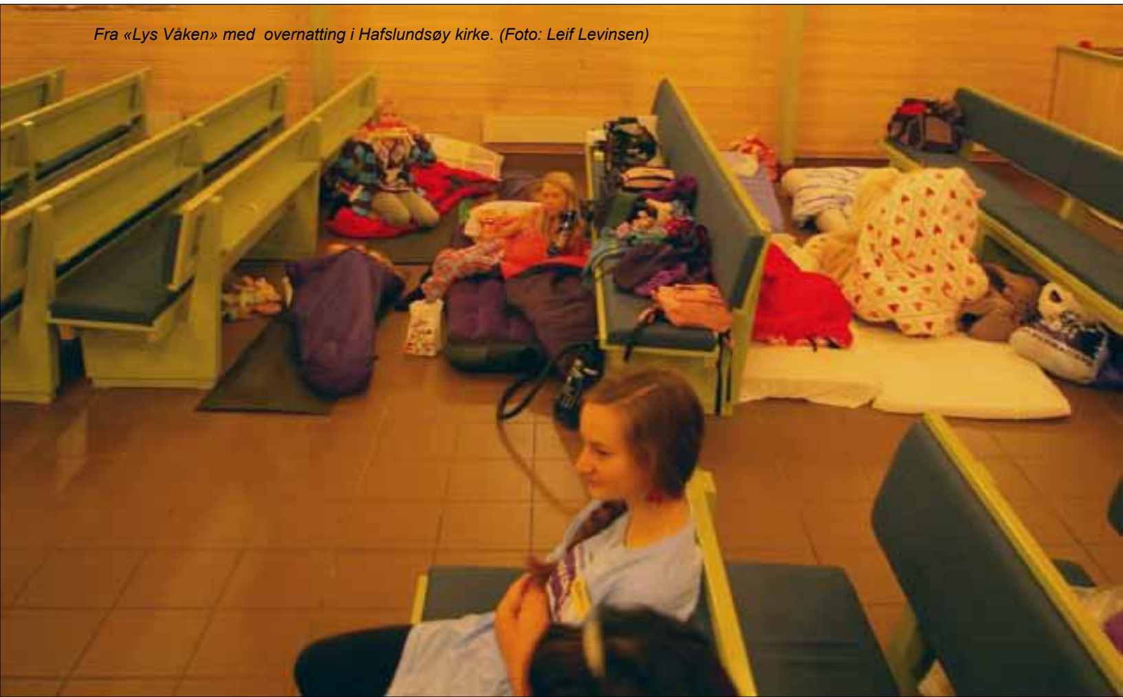
Fra «Lys Våken» med overnatting i Hafslundsøy kirke.

For 12-14 åringene, fram mot konfirmasjonsalder finnes et tilbud som heter «Friends». Dette er noe alle menighetene i Sarpsborg samarbeider om. «Friends» er en stor «happening» som foregår i gymnastikksalen på Greåker videregående skole en fredagskveld nå i februar.