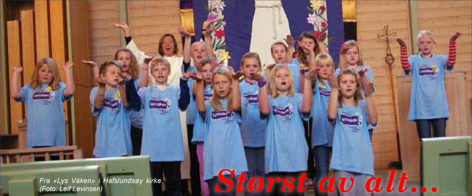
Fra «Lys Våken» i Hafslundsøy kirke.