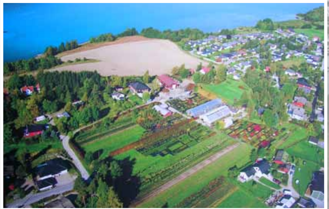
Flyfoto 56 år senere dokumenterer til fulle utviklingen av Vestby Planteskole – men også den boligreisingen som har skjedd i området siden midten av forrige århundre.