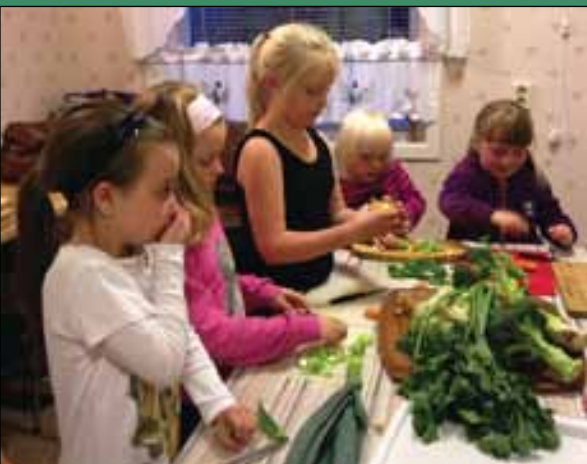
Vi lagde grønnsaksuppe. Den smakte helt nydelig!