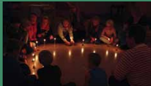
Lystening under andakt.

Lederne og medhjelpere ønsker «gamle» og nye medlemmer velkommen til klubbkveld i Betel på Ise i 2013!