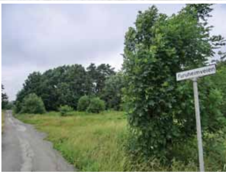
Den gamle skoletomta inn for Furuheimveien er nå fullstendig tilgrodd. For 65 år siden lå det skole med to mål skolehage her.