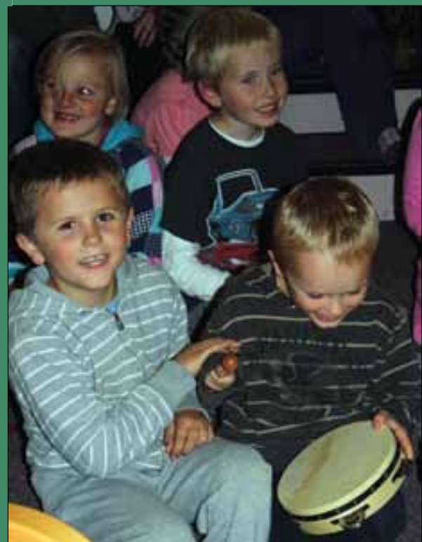
Test av instrumenter på en samling