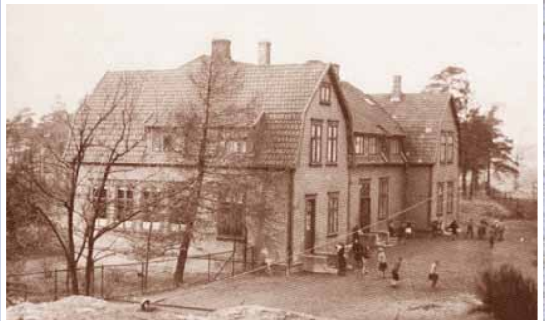
Hafslundsøy skole sto ferdig i 1905, ble påbygd i 1919 – og ble totalskadet i brann i 1948. Bildet er hentet fra boka «Tune 1800-1930» (utgitt i 1983).