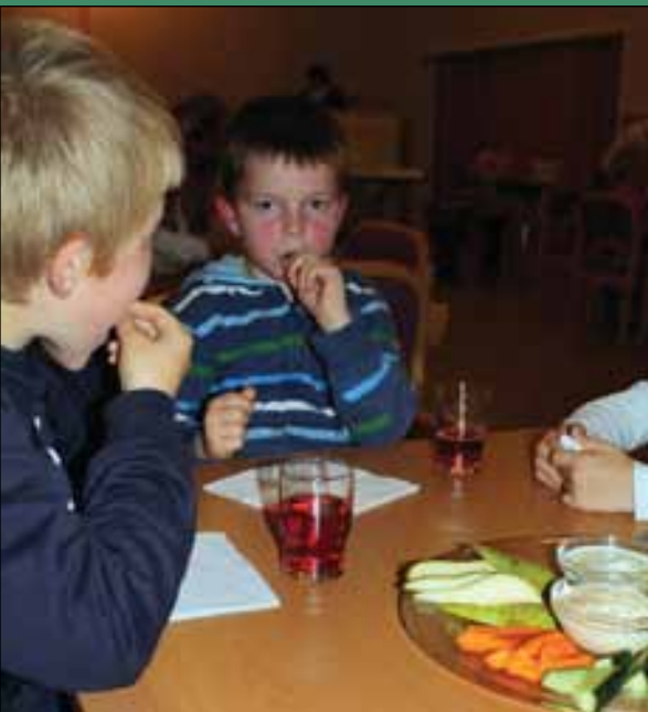
Frukt og grønt smaker enda bedre med dip.