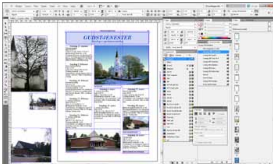
Varteig Menighetsblad produseres nå med et dataprogram som heter InDesign.

I desember 2010 ble bladet for første gang trykket i farger, og slik har det vært siden. Siden sommeren 2011 har bladet kommet ut med 16 A4-sider i hvert nummer.