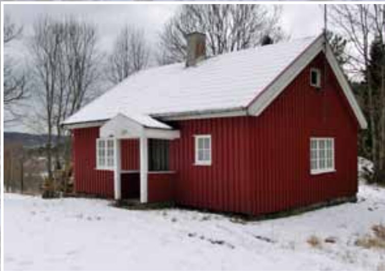
Den sjarmerende røde stua på Rud/Køya er omkring 150 år gammel. Er utsikten mot Gryte borte på grunn av vegetasjon, vil man til venstre for boligen se at man fortsatt har utsyn mot Tangen.