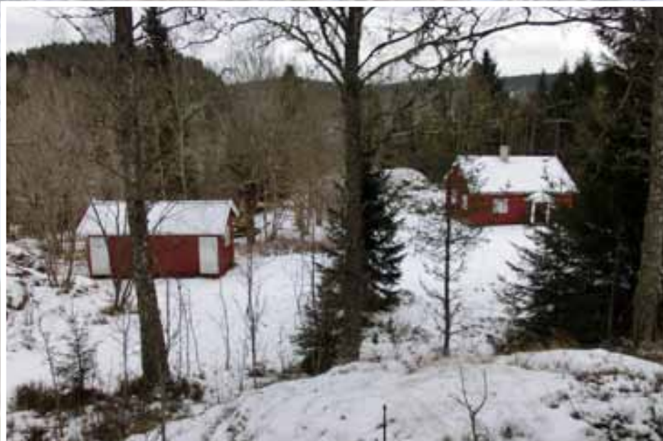
Lagården er borte, til fordel for et nyere uthus – men boligen fra omkring 1860 er holdt i svært god hevd. Den mest merkbare forskjellen er nok at utsikten mot Hestehagen og Gryte er borte. Skogen har tatt over der det før var beite.