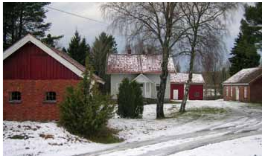
Meieri-eiendommen slik den framstår i dag. Vi ser fra venstre grisehuset, boligen, uthuset og meieribygningen. Historielaget har for øvrig også fått kjelleren som hørte prestegården til, og som står nærmere Ingaveien.