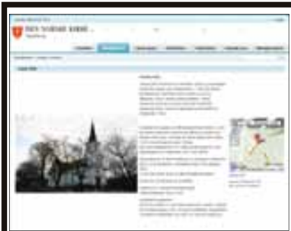
De nye internettsidene til Kirken i Sarpsborg.