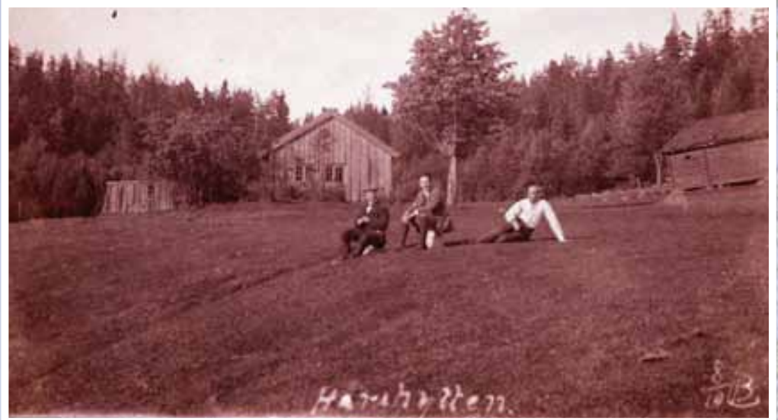
Bilde av Harehytta tatt omkring 1920. Vi ser stuebygningen rett fram, låven til høyre og kjellertrevet til venstre.