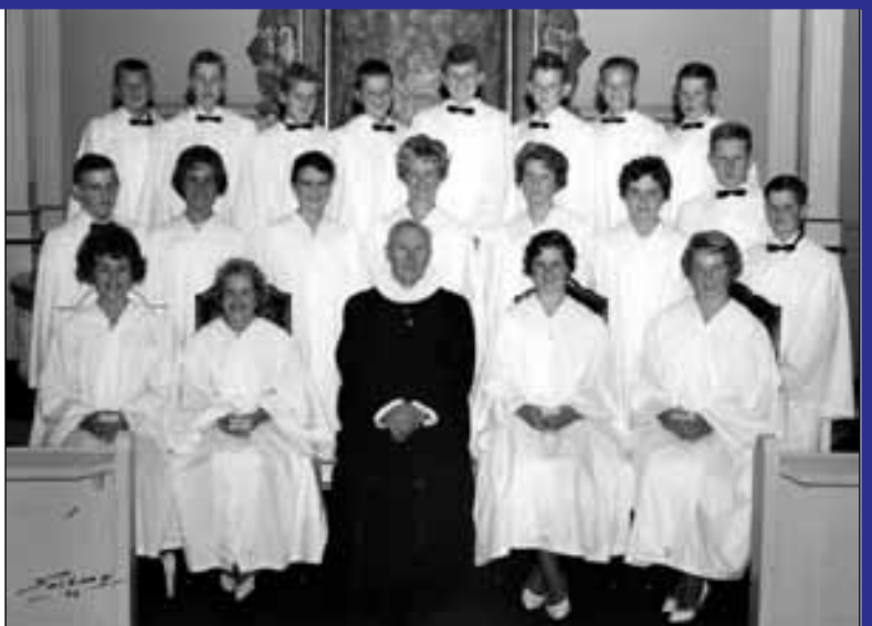
Bildet som ble tatt av konfirmantkullet i 1963.

med menigheten. Etter gudstjenesten fikk de hesteskysst til Bygdehallen. I bygdehallen inviterte menighetsrådet 50-års-konfirmantene på lunsj, og der ble flere minner fra oppveksten i Varteig delt. Etter lunsjen kunne de fortsette praten i kantinen i kjelleren på det nyeste rådhusbygget.