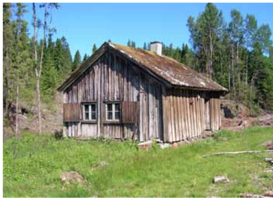
Bolighuset på Harehytta slik det framstår i dag – henimot identisk med hvordan stua ble reist for drøyt 200 år siden.