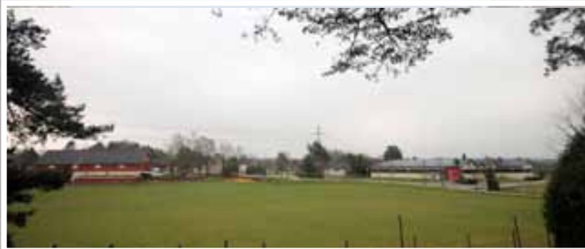
Slik ser det ut på gårdsnummer 2095, bruksnummer 5 Helgeby nå. Anlegget til Gundersen Galvano A/S til høyre.