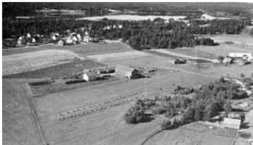
Flyfoto fra 1951, med gårdsnummer 2095, bruksnummer 2 og 3 Helgeby. Eiendommen inngikk i avtalen som ble skrevet i 1774. Gården eies i dag av Jaran Gjerløw.