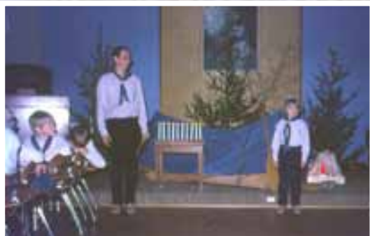
Speiderne på Hafslundsøy benyttet bedehuset. Her fra en opptagelse.