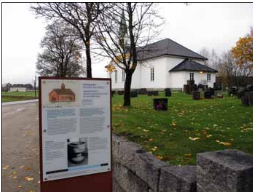
Dette informasjonsskiltet står ved inngangen til kirkegården på sydsiden, mellom kirken og gravkappellet.