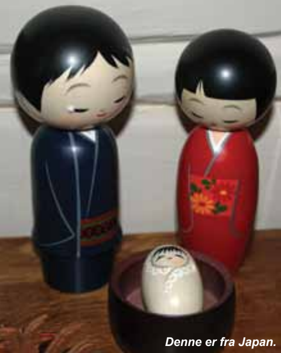
Denne er fra Japan.