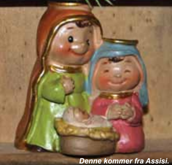
Denne kommer fra Assisi.

På reise til Tsjekia fant hun en julekrybbe laget i krystall, og den inngår i samlingen.