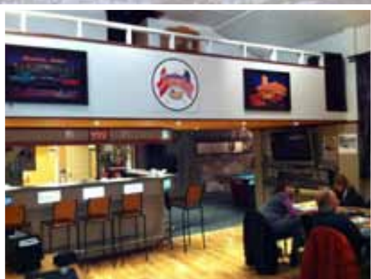
Slik ser det ut i klubblokalene til «Detroit Cars».