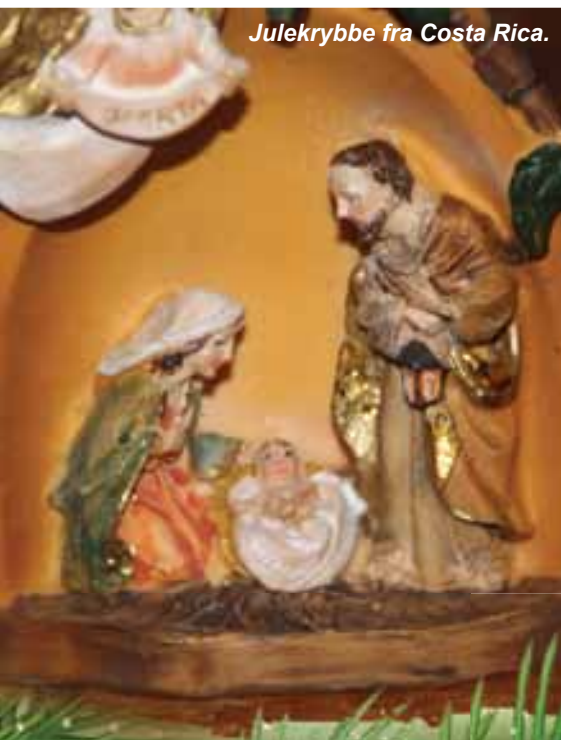
Julekrybbe fra Costa Rica.