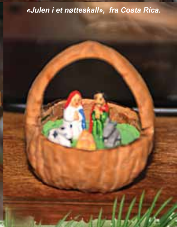
«Julen i et nøtteskall», fra Costa Rica.