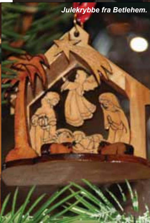
Julekrybbe fra Betlehem.