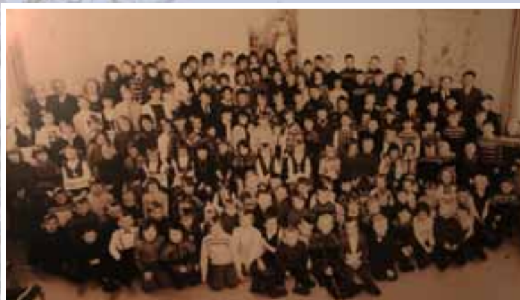
Søndagsskolen i 1963. med rundt 160 barn.