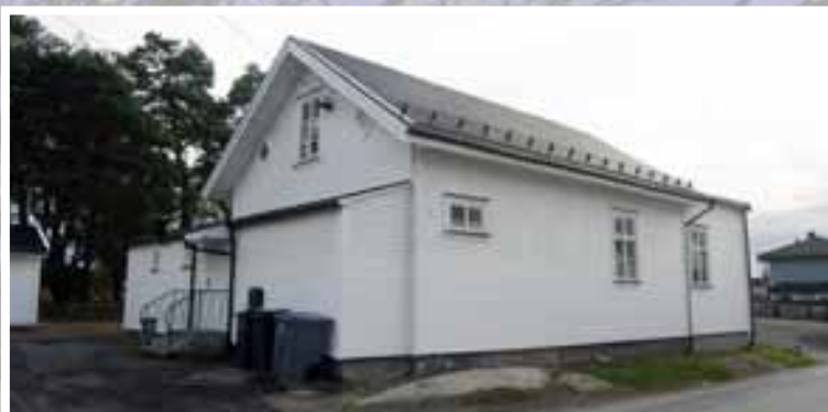
Bedehuset, slik det ser ut i dag.