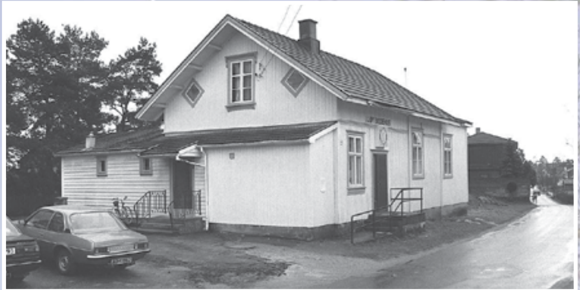
Bedehuset, slik det så ut i 1995