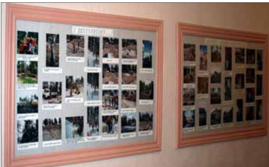
I underetasjen på kirken kan besøkende se mange flotte foto-minner fra byggeperioden.