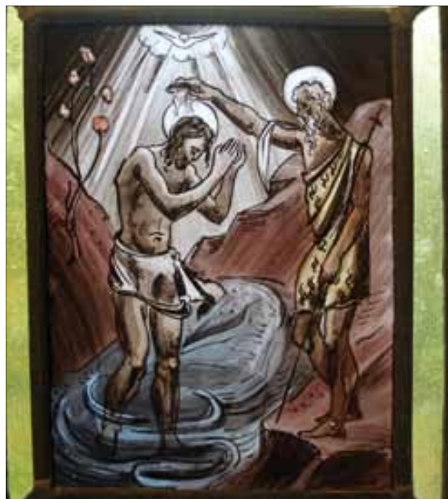
Ett av de mange glassmaleriene som er i Varteig kirke. Her er motivet Jesus som blir døpt av Johannes. (Foto: Ketil Strebel)

Dette er det nordre vinduet i kirketoret, med seks bibelske illustrasjoner, fire profeter og et vell av detaljmotiver. (Foto: Ketil Strebel).