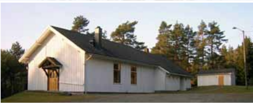
Forsamlingslokalet Breidablikk slik det framstår i dag. Venneforeningen vet å holde huset godt i hevd.

Det ble blåst nytt liv i gutteforeningen i 1974, og året etter startet man med «Åpent hus»-kvelder der ungdommen kunne stikke innom til forskjellige aktiviteter og forfriskninger. I 1979 startet også ungdomsklubben Ørneredet, som fort ble en del av konfir-mantarbeidet.