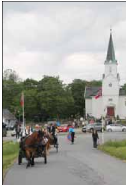
Når bygdedagen arrangeres i Varteig er alltid 50-årskonfirmantene invitert til kirken.

Bladet kom ut med 6 nummer i 2015. Det er Ketil Strebel som er ansvarlig redaktør. Bladet deles ut av frivillige medarbeidere, og er også lagt ut på Internett ( www.varteig.menighetsblad.net ).