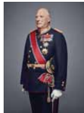
H.M. Kong Harald kommer til olsokgudstjenesten 29. juli.

Vi viser til kirkens hjemmeside for oppdateringer, http://www.sarpsborg.kirken.no