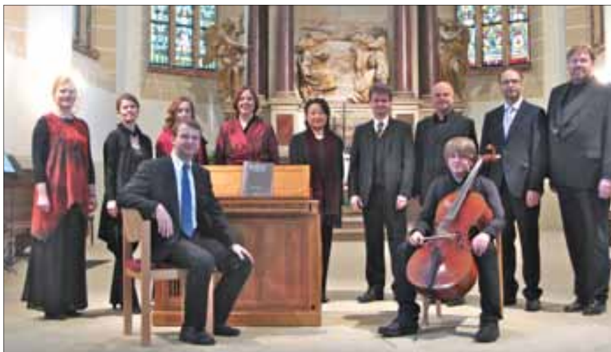
Dresdener Vokalensemble Caro Canto.

Torsdag 3. november kl. 18.00 blir det foredragskveld med lektor og forfatter Inge Eidsvåg og sang fra en jentegruppen Helcamida fra Lørenskog.