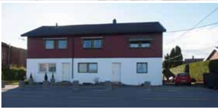
Nordbyveien 89, slik huset ser ut i dag.