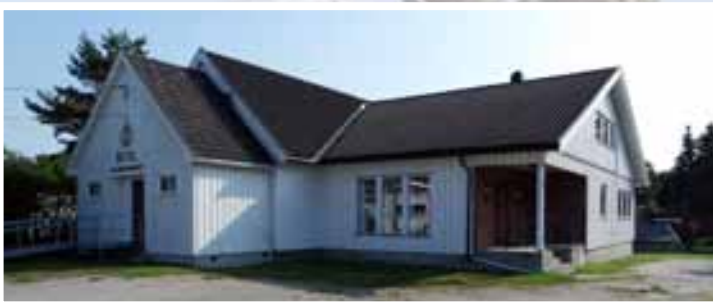
Forsamlingslokalet Betel på Ise. Kjernen i bygget er en skolestue som ble reist for nesten 150 år siden.

Betel består av en stor sal med peisestue, kjøkken, stor gang med garderober, klosetter, lagerrom og aktivitetsrom i andre etasje. En storstilet innvielse av nye Betel fant sted 24. oktober i 1993. Da var det tidligere gjort et mindre tilbygg som ga rom for toaletter.