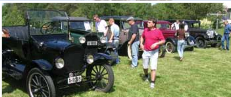
Utstilling av gamle kjøretøy er alltid populært. Her fra veteranbil-mønstringen i 2006.

I serien «Før og nå» er tanken å presentere en artikkel i hvert nummer av Menighetsbladet. Varteig Historielag har tatt på seg ansvaret for artikkelserien.