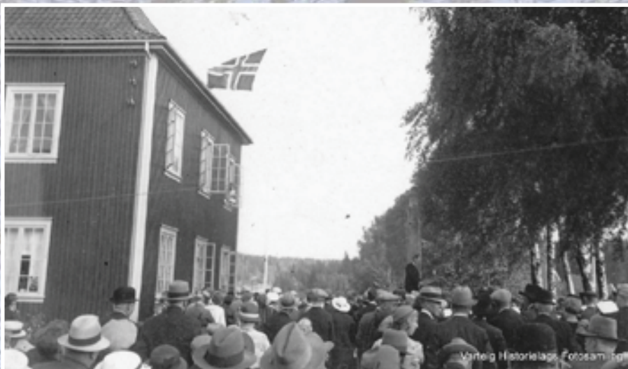
Inga-bautanen utenfor Bygdehallen ble avduket på bygdedagen i 1935.