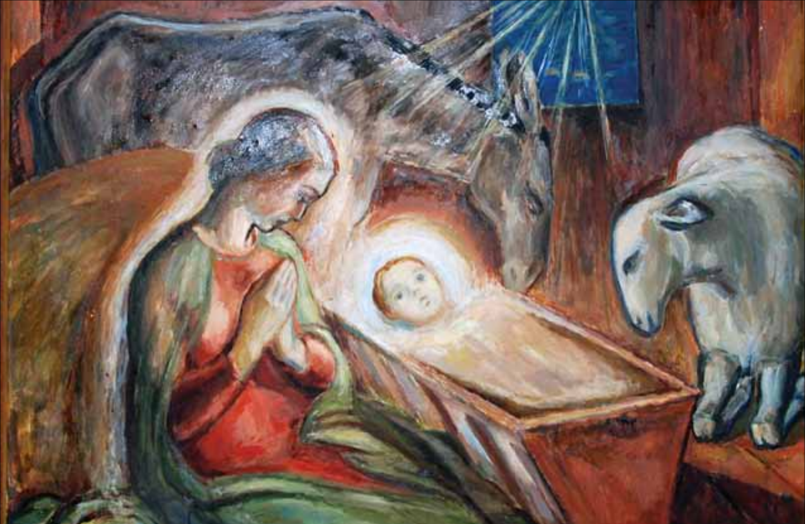
Julenatt Altertavle Tistedal Kirke.