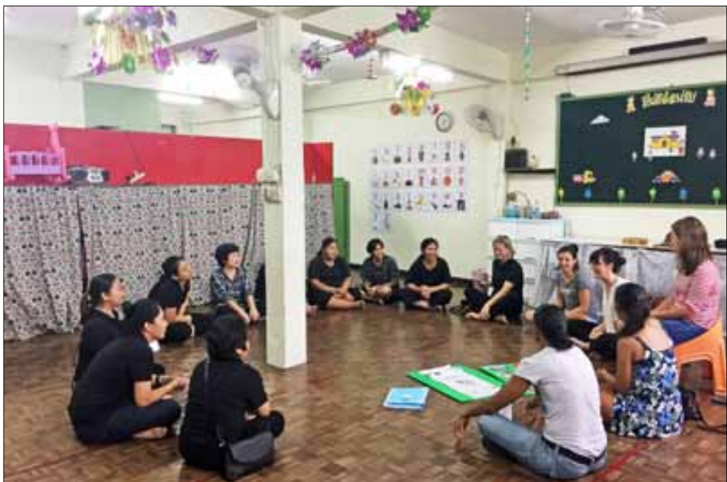
Lesekroken på Immanuel kirkens daghjem.