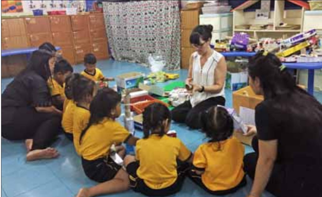
Lærere fra Bangkok Patana School underviser og deler av sine erfaringer med personalet på Immanuelkirkens daghjem.

Misjonsselskapets barnearbeid i nord-øst-Thailand er Varteig menighets misjonsprosjekt. Menigheten samler inn kollekt til prosjektet og arbeidet blant barna er ofte bønneemner i menigheten, blant annet i kirkebønnen hver søndag.