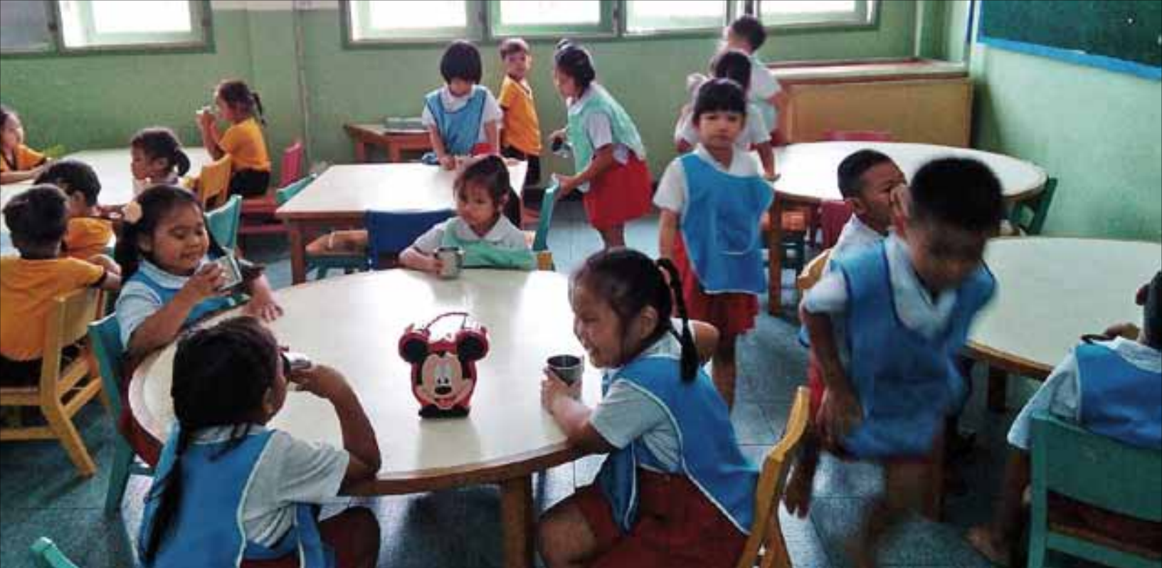
Glade barn på Immanuel kirkens daghjem.