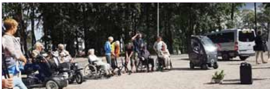
Torsdag 26. juli blir det tilrettelagt pilegrimsvandring i Kulås.