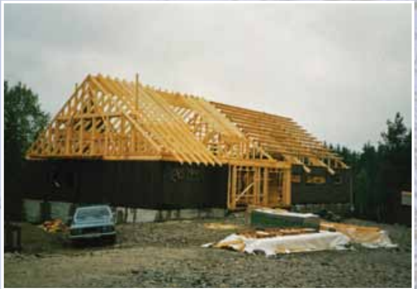
Menighetsbygget reiser seg.