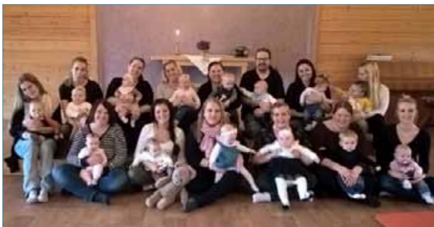
Babysang har vært et populært tilbud i Varteig i 19 år. Her et bilde fra 2016.