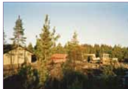
Fra anleggsarbeidene for nytt menighetshus. Til venstre ser vi barnehagen.