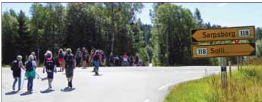
Pilegrimsvandring ved Solli.

Det blir også en egen barne og familievandring lørdag 28. juli kl. 12.00 - da har Borgarsyssel museum åpen dag – det blir tidebønner ved St. Olav Vocale