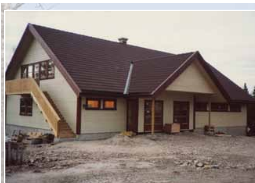
Arbeidene med menighetsbygget slutføres. Innvielsen var i 1992

I serien «Før og nå» har vi de to siste årene presentert de kristne forsamlingslokalene i Varteig.