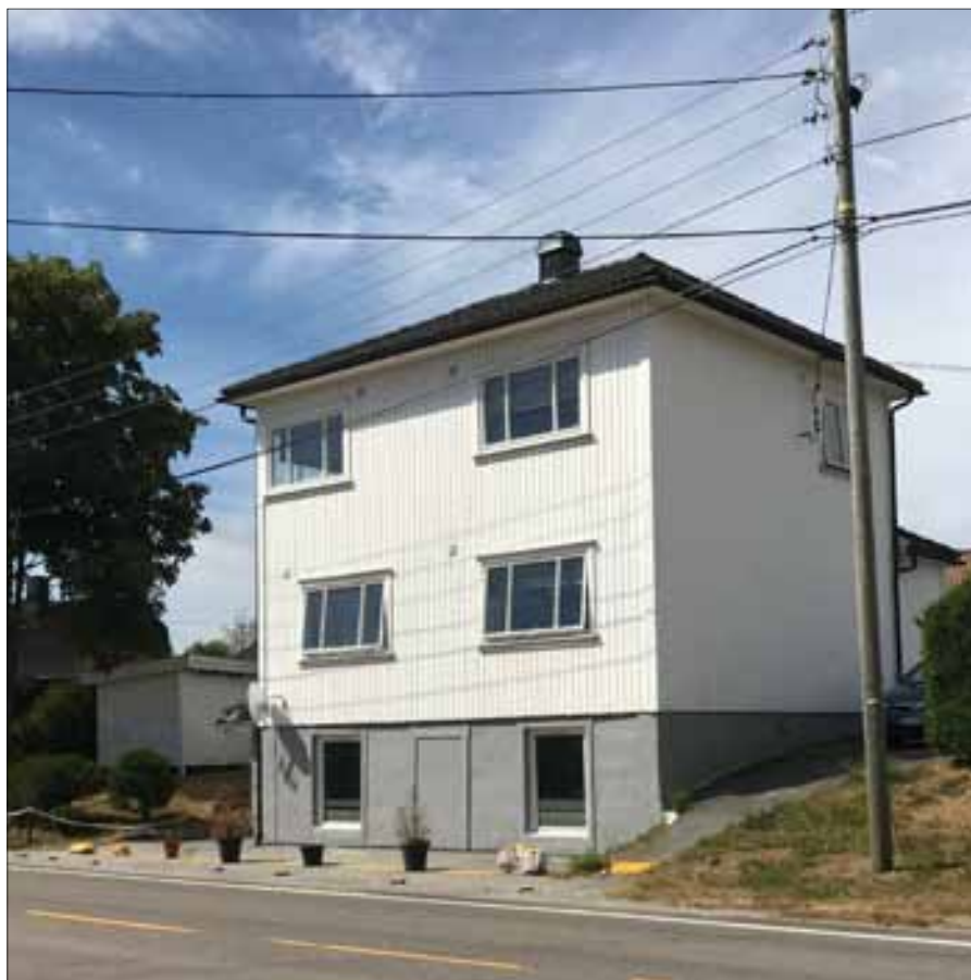
Nordbyveien 53 i dag. Døren til «Kjellerbutikken» er i dag flyttet til sørenden av huset.