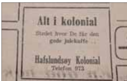
Faksimile fra SA, julen 1952.