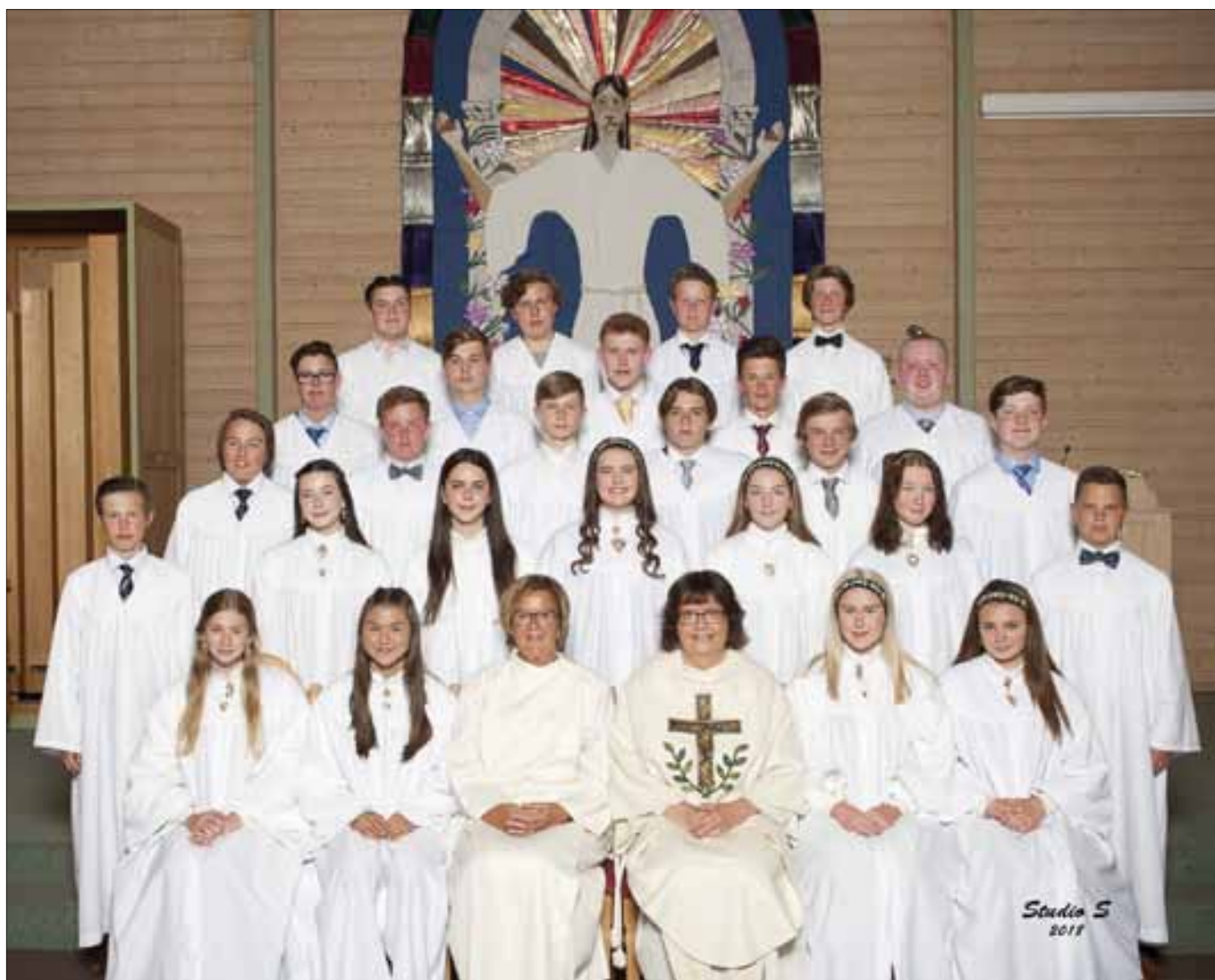
Konfirmantene i Hafslundsøy kirke lørdag 2. og søndag 3. juni.