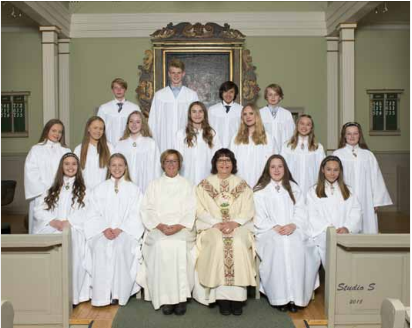
Konfirmantene i Varteig kirke lørdag 9. og søndag 10. juni.