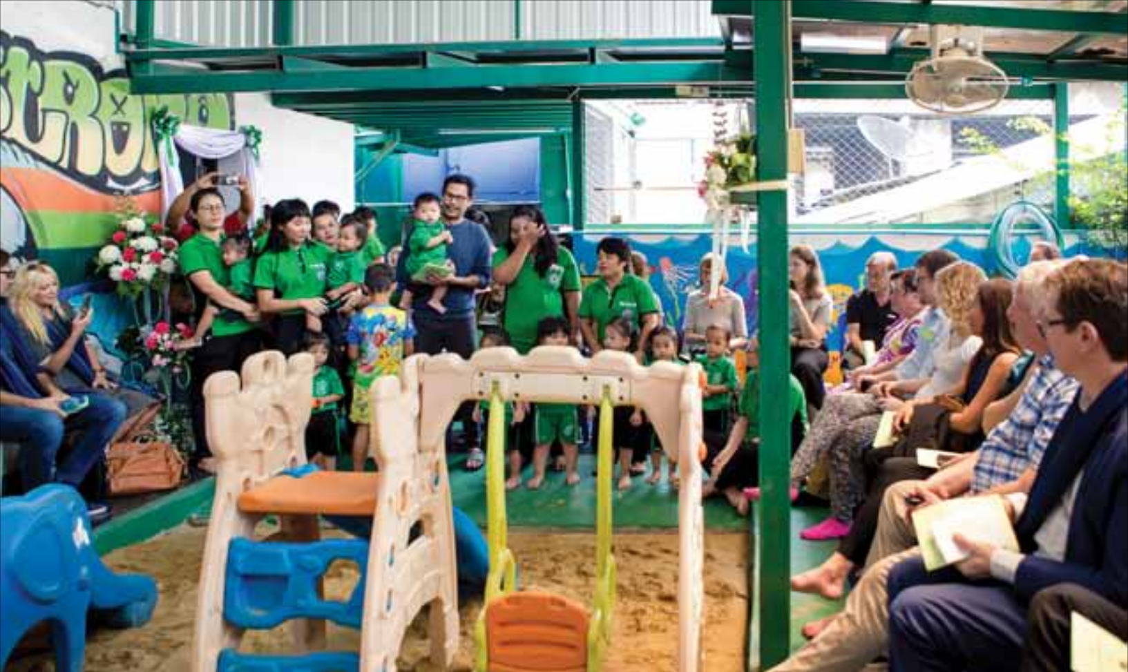
Mange kom for å være med på åpningen av den nye delen av Lovsangshjemmet.