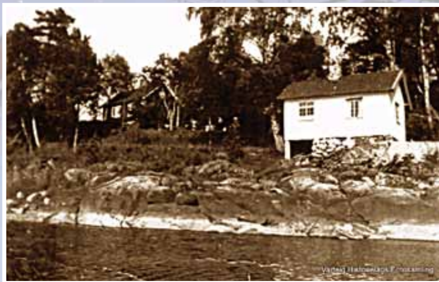
Hovedbygningen på Haven slik den framsto, trolig på 1950-tallet en gang.