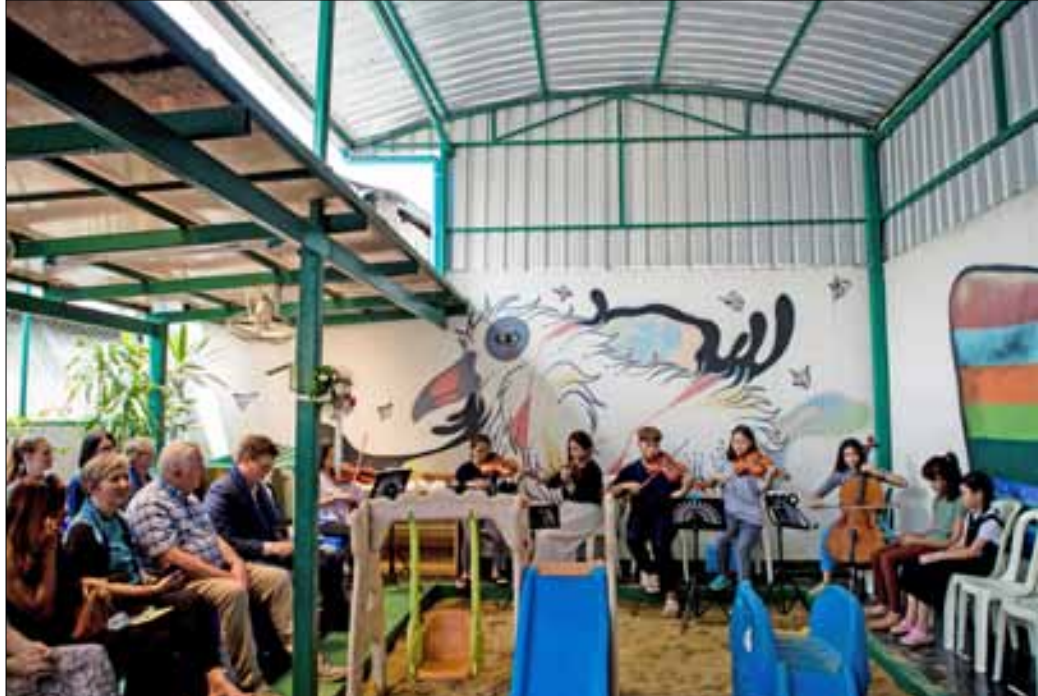
En gruppe fra Immanuel musikk-skole spiller før den offisielle åpningen.

Varteig menighet samarbeider med NMS om arbeidet i Thailand, som menighetens misjonsprosjekt. Det innebærer at menigheten samler inn penger til prosjektet, tar det med i sine bøtter og bidrar til å spre informasjon. Offeret i kirkene våre går til misjonsprosjektet flere ganger hvert år.