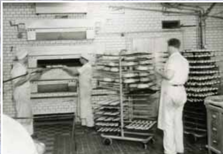
Asbjørn M. Skoglund, Øivind Magnussen og Asbjørn Belsby i bakeriet 1947.

I 1960 ble bakeriet påbygd 120 kvm med full kjeller og klart til bruk året etter. Her ble den første tunnelovnen i Østfold installert. Baking av lefser og lomper kom i gang og produksjonen ble flerdoblet og nye marker måtte pløyes.