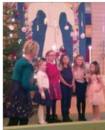
«Minsten» sang under juletreffesten i Hafslundsøy kirke den første søndagen i januar.