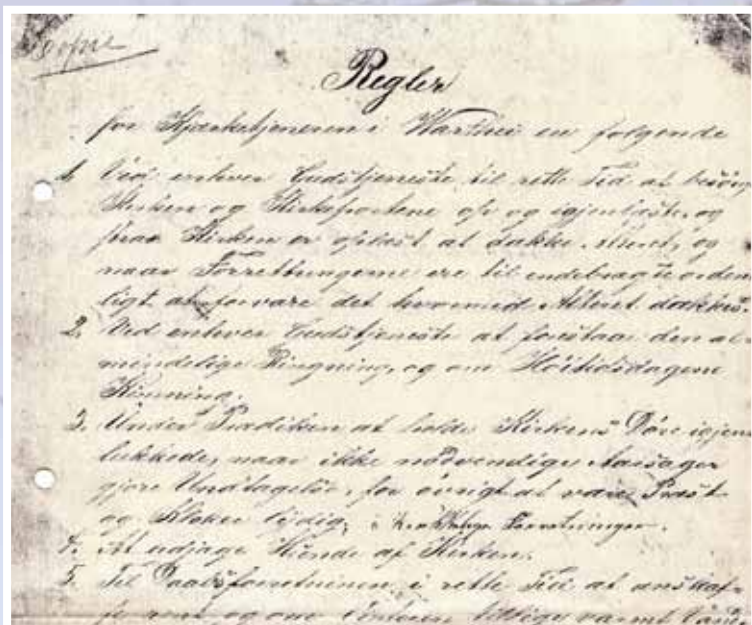
Utsnitt av reglementet for «kjærketjeneren i Warthei», som blant annet påla ham å jage løsbikkjer ut av kirkeskipet.