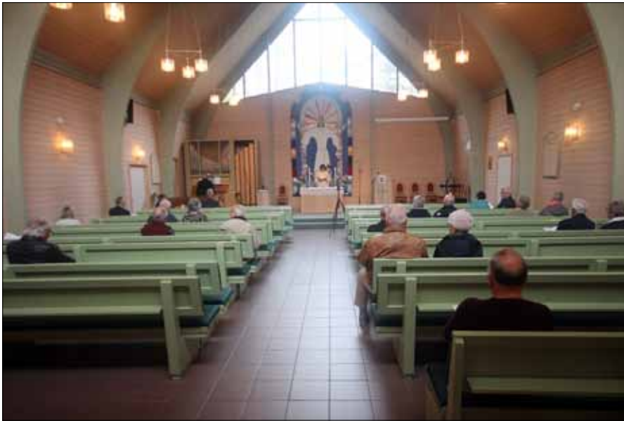
Gudstjeneste i Hafslundsøy kirke 10. mai i fjor, da etter åtte uker opphold.