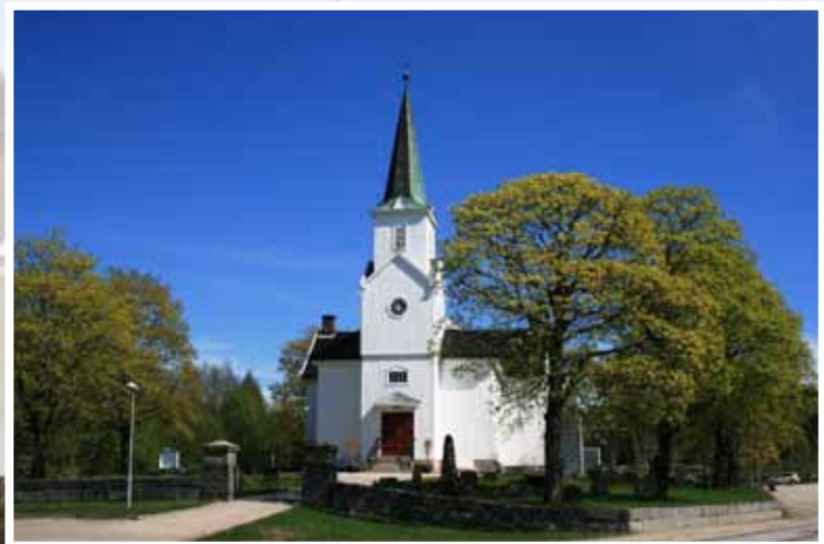
Varteig kirke, fotografert i 2011.

Vi har fått låne noen gamle kirkebilder, og presenterer dem her sammen med mer moderne bilder av kirken.