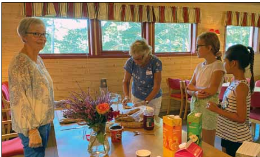
Varteig menighet har mange frivillige, som blant annet stiller opp når «globusagentene» trenger mat.

Alle menigheter oppfordres til å markere frivilligheten og skaperverket på denne dagen. Organisasjonen Frivillighet Norge koordinerer Frivillighetens år, og har skaffet midler tilveie som det kan søkes om til hvert enkelt