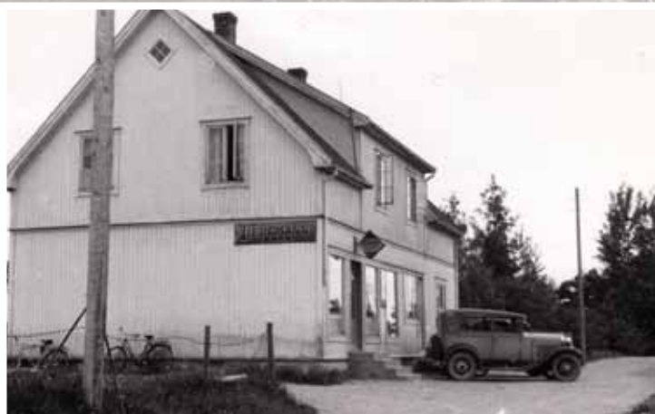
Butikken til kjøpmann Ragnar Berg.