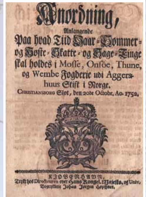
Forsiden på den kongelige «Anordning» fra 1752 som regulerte tidspunktene for bygdedingene i blant annet Varteig og Tune.