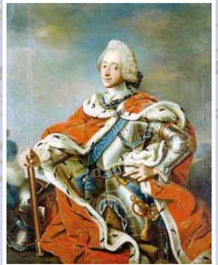
Kong Fredrik V av Danmark-Norge.

(Dette er et utdrag av en artikkel som sto i Varteig Historielags årstidsskrift Inga i 2012.)