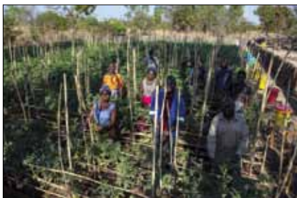
Nye metoder: Agronomen har ansvar for 17 områder med 12 bønder i hvert område. Han lærer dem om nye metoder og hvordan en får mest ut av grønnsaksåkeren sin.

– Målet mitt er å få andre til å se hvordan de selv kan endre sine liv. Som nyutdannet håpet jeg at jeg skulle få oppfylt min drøm om å jobbe i Kirkens Nødhjelp. Nå gjør jeg det, og det gjør meg glad og takknemlig. Måten Kirkens Nødhjelp jobber med lokalsamfunn på, er riktig og viktig. Jeg er veldig stolt over at jeg får være med på å forandre verden.