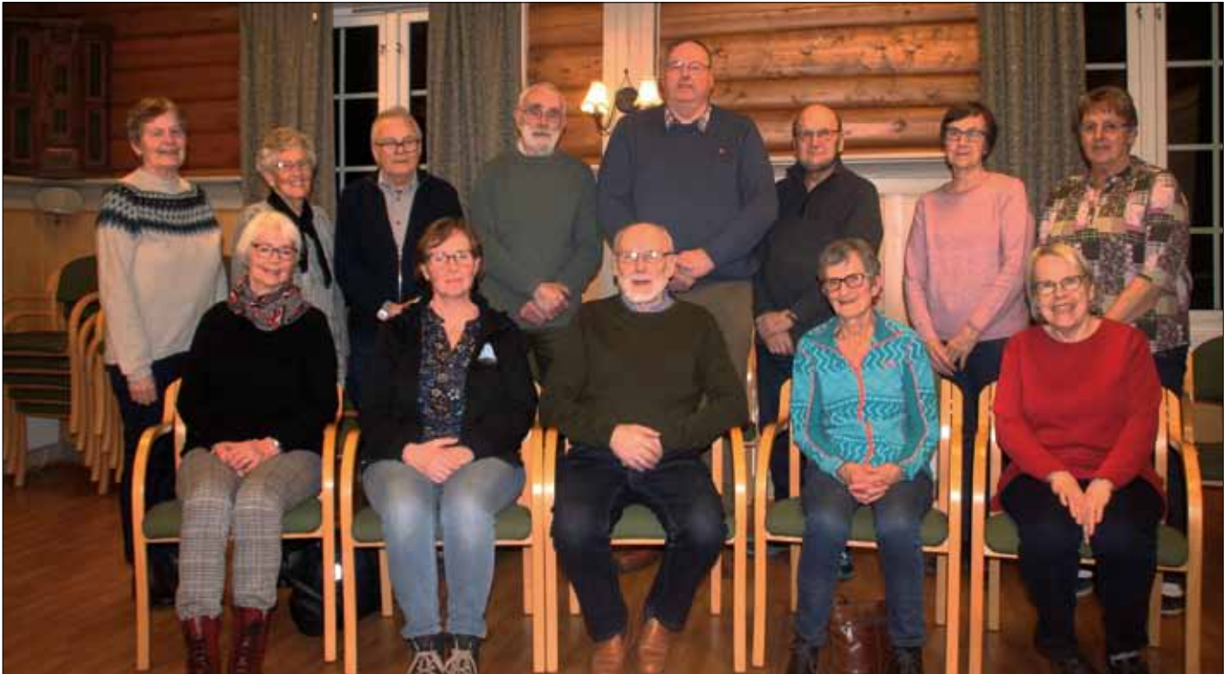
Varteig Menighetskor er 50 år i år, og skal ha jubileumskonserter i Hafslundsøy kirke den 28. april. Her fra en øvelse i Bygdehallen i Varteig. Fire av medlemmene var ikke til stede da bildet ble tatt.

I år er det 50 år siden Varteig Menighetskor ble startet. Jubileet blir markert med en konsert i Hafslundsøy kirke torsdag 28. april kl. 18.30.