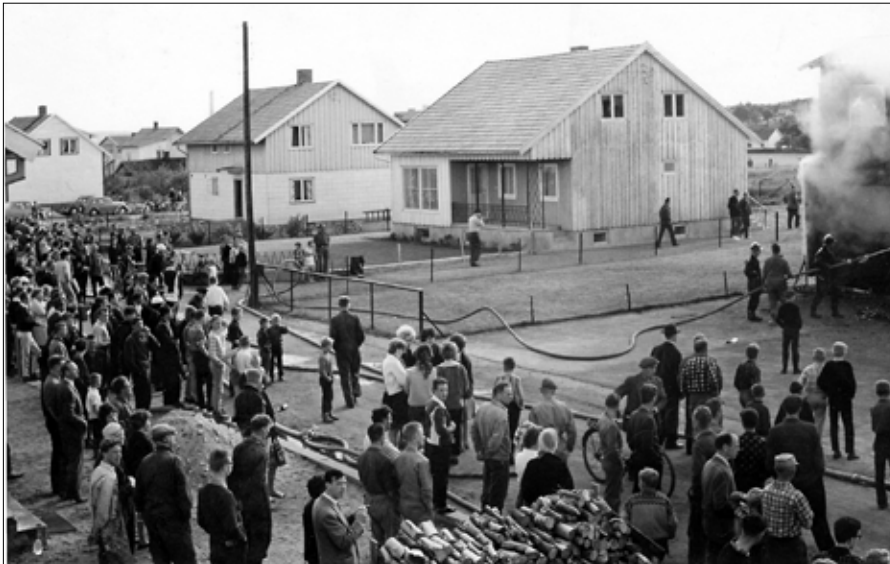
Fra brannen i Hagastuveien Handel.