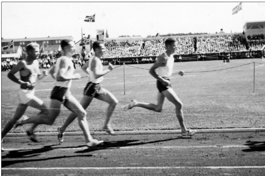
NM i friidrett ble arrangert på Sarpsborg Stadion 12.-14. august 1960. Her fra finalefeltet på 5000 meter for herrer.