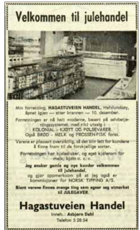
Annonsen i Sarpsborg Arbeiderblad 18. desember 1962.