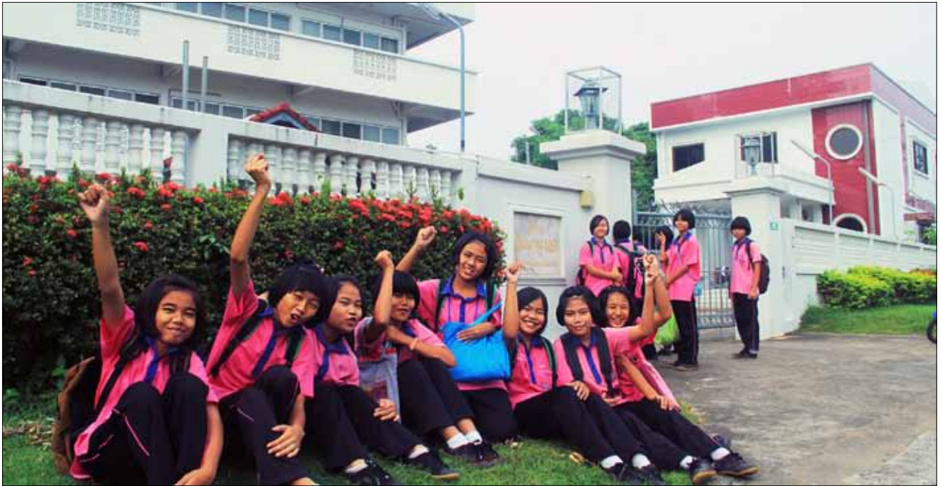
Immanuelshjemmet er en del av NMS' arbeid i Thailand, som Varteig menighet støtter gjennom sin avtale med NMS.