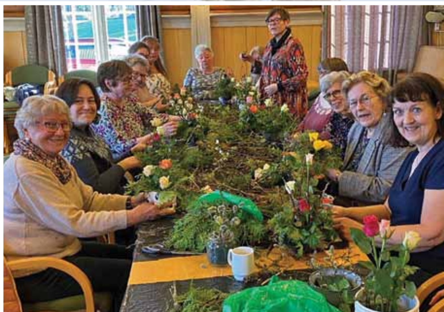
Lagsmøte: Vi lager vårdekorasjoner.

Bygdekvinne har alltid hatt stort engasjement for nærmiljøet. Omsorg for de eldre har vært viktig. Det er kanskje ikke så rart når vi tenker at frem til etter andre verdenskrig så var det ingen annen løsning enn at de eldre ble stelt i hjemmene av husmora. Det kunne være en stor byrde for husmora å både ha barn, husdyr og ansvar for de eldre i familien. Dette var før engangsbleier, vaskemaskin og annet utstyr gjorde hverdagen enklere både for barn og eldre.