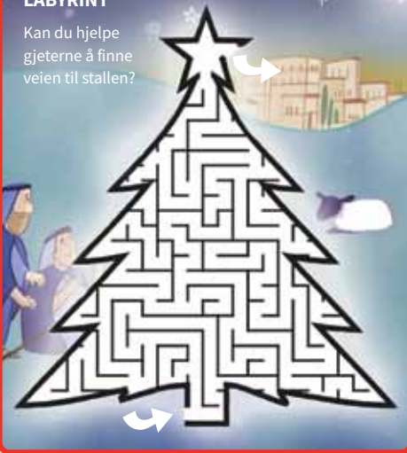
Tegninger: EMILY FOX

Kan du hjelpe gjeterne å finne veien til stallen?