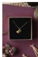
MAMMAHJERTET Sølv kr 1590 Gull kr 1990