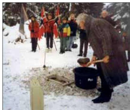
Biskop Even Fougner la ned grunnsteinen 27. november 1993.

Den 12. juni 1995 er også en dato som godt kan nevnes. I et 20-talls år hadde det blitt arrangert årlige gudstjenester på kirketomten. Denne juni-søndagen i 1995 ble den første gudstjenesten