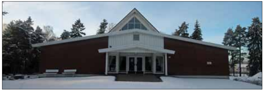
Hafslundsøy kirke ble innviet 3. desember 1995.