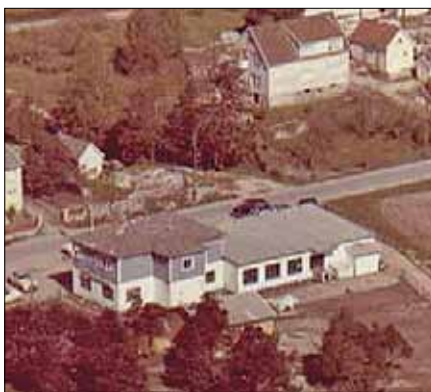
Flyfoto fra 1962.