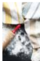
KJØKKENHÅNDKLE I ETIOPISK BOMULL Gull, teal eller beige kr 200