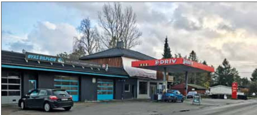
Slik ser det ut i dag.