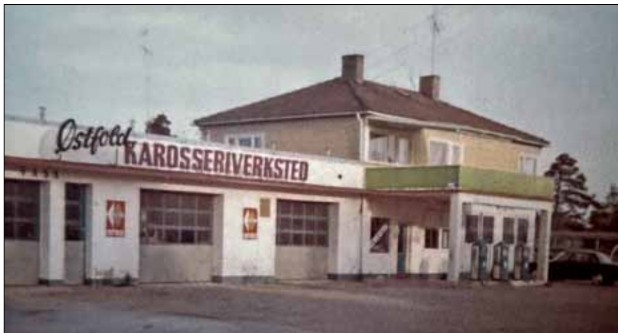
Østfold Karosseriverksted ble etablert i 1961 som en direkte fortsettelse av Hafslundsøy Auto.

Å skaffe seg bil var en av de store drømmene for mange, ikke minst ungdommer på 1960-tallet. De som ikke hadde råd eller mulighet til det, kjøpte seg gjerne moped, eller aller helst en scooter. Men det var bil som var tingen. Hadde du det, hadde du også et forsprang på veldig mange områder. Bilen var en revolusjon. Den endret reisevaner, vare- og persontransport, bosettingsmønster, fritid og ferievane. Den ble det viktigste symbolet på velstand og uavhengighet, før den fra 1970-årene også ble forbundet med forbrukersamfunnets skyggesider som