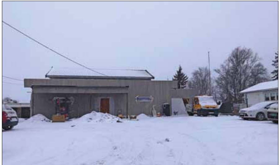
Nå foregår det byggearbeider i Hagastuveien 25.