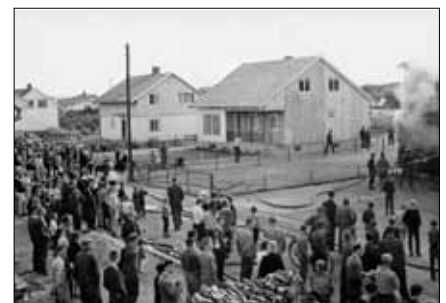
Fra brannen i Hagastuveien Handel i juni 1962.