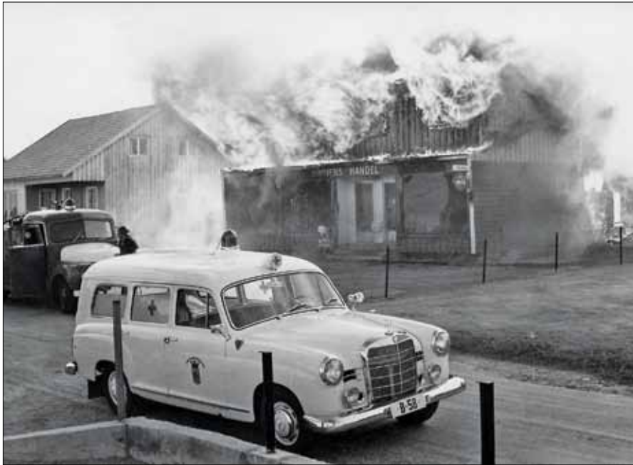
Brannbil og ambulanse på plass i Hagastuveien.

innsats. Naboene hjalp til ved å bruke hageslanger og oversprøyte veggene med vann.