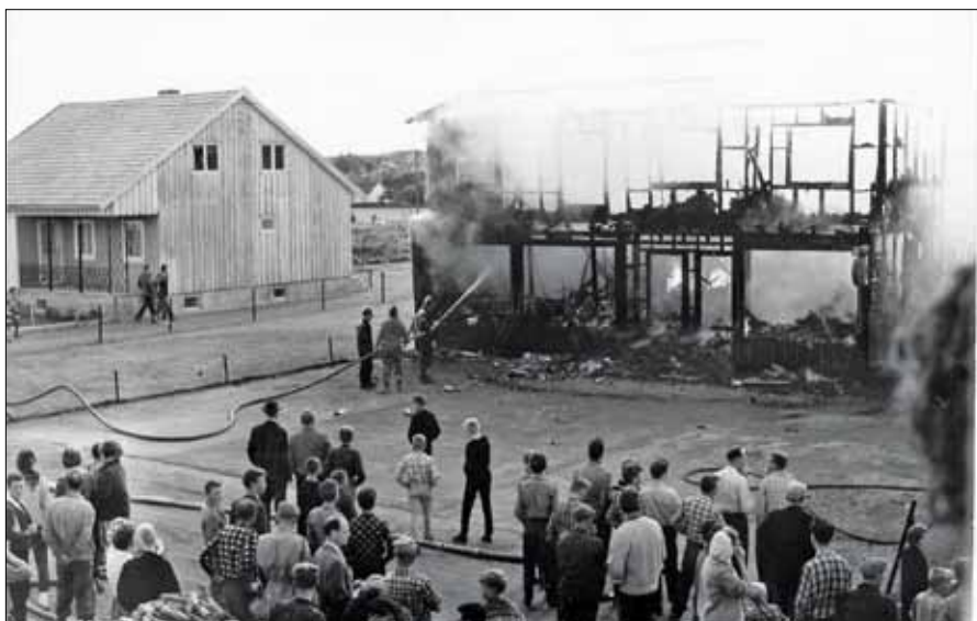
Det samlet seg mange skuelystne da brannvesenets mannskaper arbeidet med å slå ned flammene.